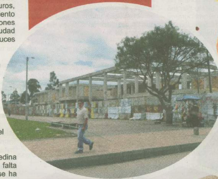
La falta de control a obras afecta a más de 1.200 niños.

D emoras en cronogramas de construcción de obras de jardines infantiles y falta de control a las que se encuentran en ejecución, evidenció la Contraloría de Bogotá.