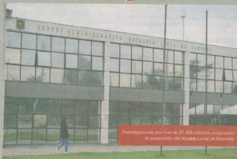
Investigaciones por más de $1.456 millones propiciaron la suspensión del Alcalde Local de Kennedy.

Fue así como el pasado 15 de agosto, mediante el Decreto 338, el Alcalde Mayor lo suspendió del cargo de alcalde de Kenendy hasta que culminen los procesos de responsabilidad fiscal en curso que adelanta la Contraloría de Bogotá.