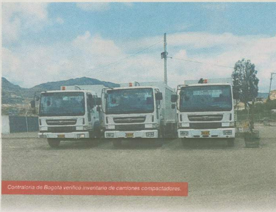
Contraloría de Bogotá verificó inventario de camiones compactadores.

Debido a la falta de controles en la empresa Aguas de Bogotá, se evidenció un presunto detrimento patrimonial por $426 millones, generado por la pérdida de 247 llantas de repuesto con sus respectivos rines, pertenecientes al parque automotor de esta entidad.